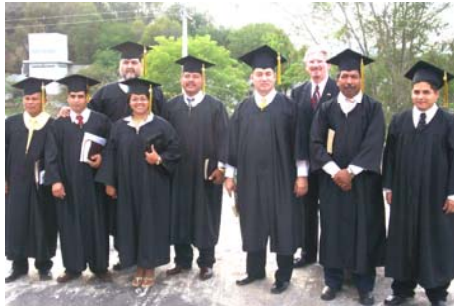
Generación 2005 – 2006