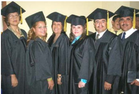
Generación 2006 – 2007