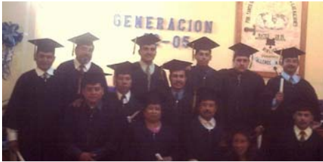
Generación 2004 - 2005

En ocho meses usted puede graduar con una Licenciatura de la Universidad Bautista de Louisiana.