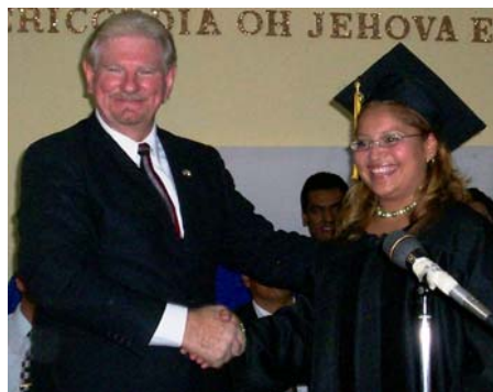
Salón de Clase